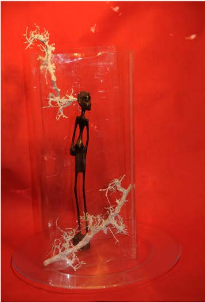
Gudrun Renner - Fotografie